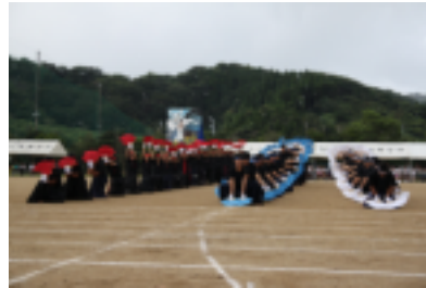
3学年合同の応援演舞