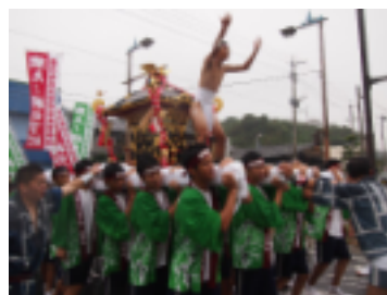
大神輿パレードの様子

秋の全国交通安全運動に合わせ、9月18・19・20日の三日間、登校時の送迎マナーの向上を目指し、PTA役員・校外生活委員会・職員による立哨指導が行われました。生徒の登下校時の安全確保が第一です。送迎の際は、時間と心にゆとりを持って指定の場所に駐車して下さいます。よろしくお願いします。