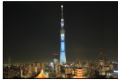
東京スカイツリー&夜景

12月11日(火)から14日(金)にかけて、修学旅行が行われました。目的地は東京を中心に、横浜や鎌倉にも足をのびしました。今年度は、鶴岡八幡宮にて歴史を学んだり、スカイツリーや科学館の見学を通して日本の工業技術について学んだりしました。さらに、東京大学での研修やキャリアガイダンスを通して、自らの未来のことを考える時間もありました。