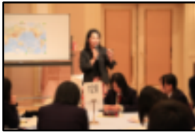
キャリアガイダンス