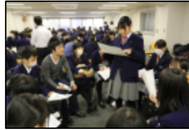
東大生と学ぶ 大学体感プログラム

一日目は、空路で東京に向かい、東芝科学館や東京スカイツリーの見学でした。東京スカイツリーの高さは634mで、世界一高いタワーとして、ギネスブックにも認定されているそうです。世界一の高さから見る夜景は生