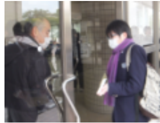
受験票を見せて入室

てだるまに目を書き入れていき ました。夕食後の学習時間には 教科書や参考書を念入りに見直 す姿や、応援に駆けつけてくだ さった先生方に熱心に質問する 姿が見られ、本番前最後の学習 にみんなが集中していました。 1月19日(土)は文系科目の 試験が、20日(日)には理系科 目の試験が行われました。3年 生はバスの中や開場までのほん のわずかな時間も学習事項の確 認に活用していました。そして、 3年間の努力の成果を一つ一つ の試験に確実に出し切りました。 センター試験は始まりに過ぎ ません。センター試験の自己採 点の結果をもとに三者面談が実 施され、それぞれの志望校に向 けた学習に3年生は一生懸命に 取り組んでいます。特別授業を